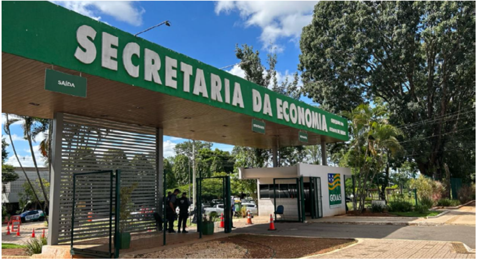
A negociação atingiu 80 mil contribuintes goianos. Foram quitados 97 mil autos de infração e realizados 50 mil parcelamentos

O “Negocie Já” foi lançado pelo Governo de Goiás no dia 1º de abril e permite desconto para pagamento à vista ou parceladamente. Os descontos de juros e multas podem atingir até 99% para pagamento à vista. O contribuinte deve ficar atento, pois a adesão ao programa termina em 29 de julho. Mais informações sobre como participar estão dis-