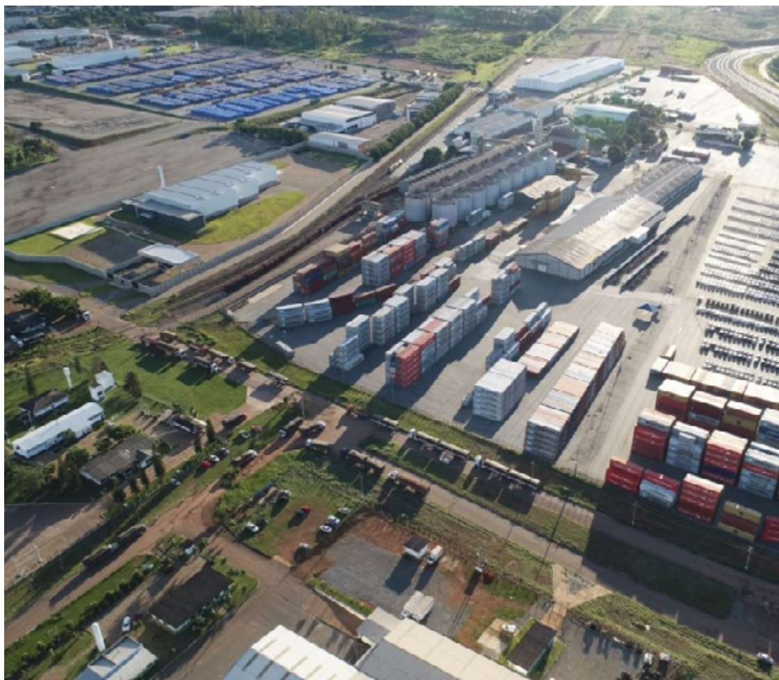
Dentre os principais produtos exportados, destacam-se complexo de soja e carnes