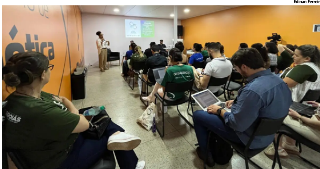
Convocação dos aprovados será por e-mail ou telefone informados no momento da inscrição

Os cursos, que são totalmente gratuitos, visam proporcionar aos participantes uma formação em diversas áreas tecnológicas e empreendedoras. Para acessar os editais e realizar a inscrição, os interessados devem acessar o site e filtrar as informações de acordo com o interesse: por município/escola; categoria (capacitação, qualificação, técnico ou superior); modalidade (EaD, online, presencial); turno (matu-