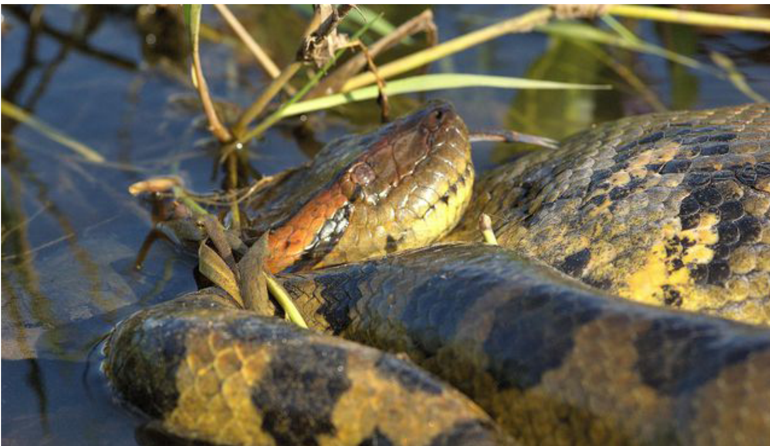
A sucuri é a maior serpente do Brasil e uma das maiores do mundo, podendo alcançar até 9 metros de comprimento

A sucuri é a maior serpente do Brasil e uma das maiores do mundo, podendo alcançar até 9 metros de comprimento. Embora não seja venenosa, sua força e tamanho a tornam um animal que inspira respeito. Essas serpentes são comuns em áreas próximas a rios e lagos, habitats que fornecem os recursos necessários para sua sobrevivência,