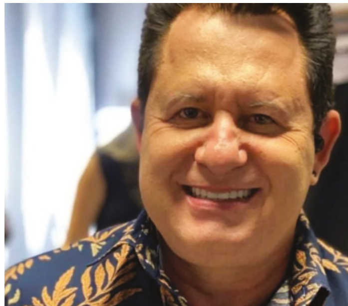
Marrone deve levar uma vida normal, inclusive na agenda de shows

Após a cirurgia, Marrone ficou internado por dois dias e agora deve permanecer em repouso por mais 15 dias. Ele fará uma nova avaliação ocular após esse período. Segundo a assessoria de imprensa do artista, a agenda de shows da dupla não será cancelada, com Bruno assumindo todas as apresentações previstas sozinho.