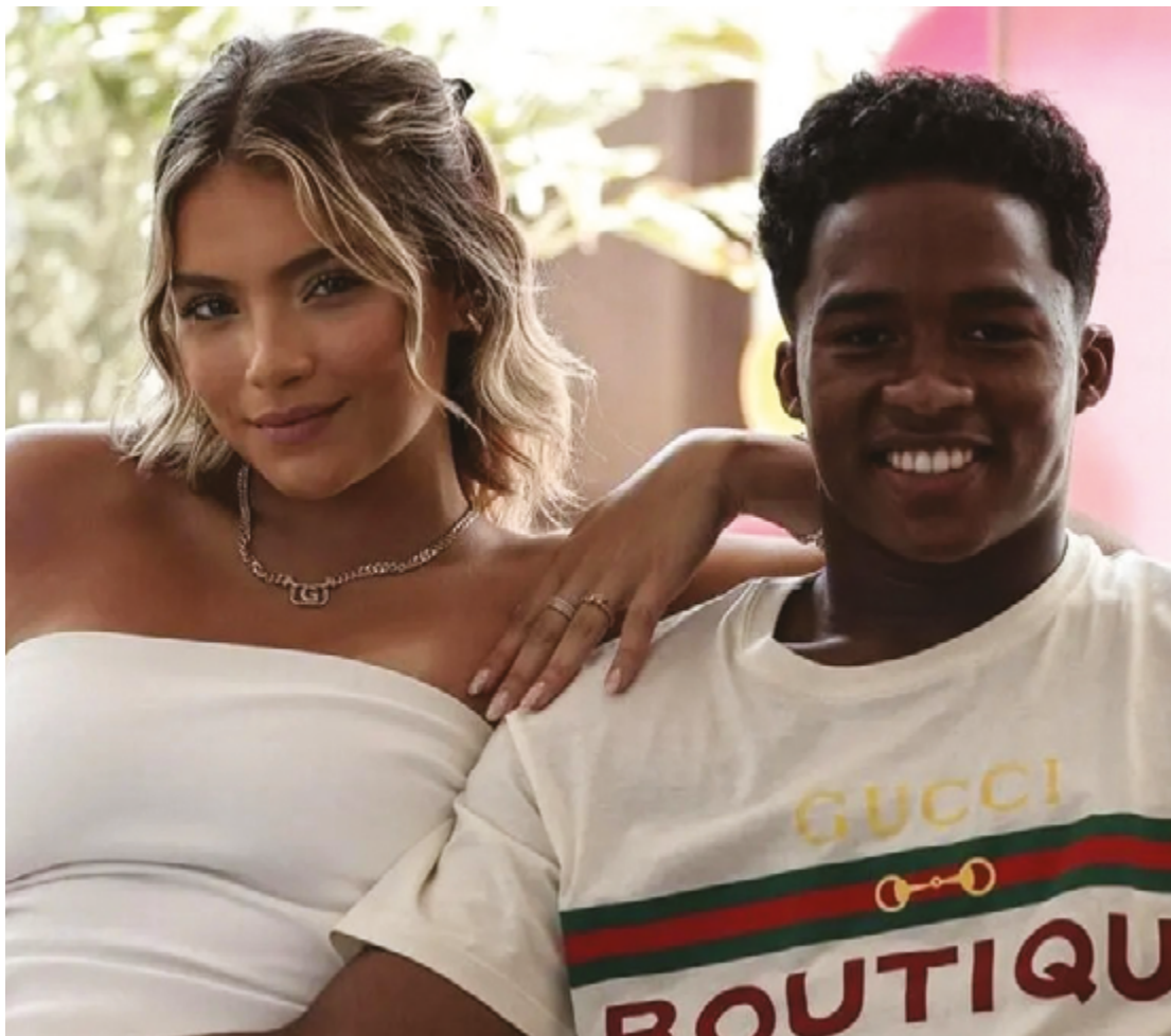
Assunto repercutiu depois de Endrick, craque da Seleção Brasileira, revelar cláusulas com a namorada