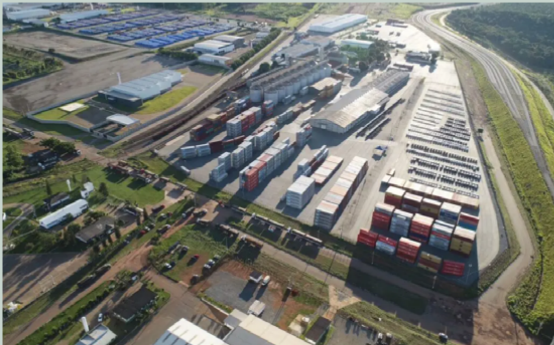
De janeiro a maio, Goiás acumula superávit de US$ 2,8 bilhões na balança comercial

Apenas no mês de maio, o saldo positivo foi de US$ 683 milhões, decorrente de US$ 1,1 bilhão em exportações e US$ 435 milhões em importações. “Há um esforço ativo do Governo de Goiás para fomentar o comércio exterior