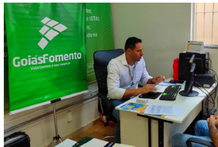
GoiásFomento garante linha de crédito pré-aprovada para nova oportunidade de negócio

Nova ferramenta da agência facilita planejamento estratégico do micro e pequenos empresários